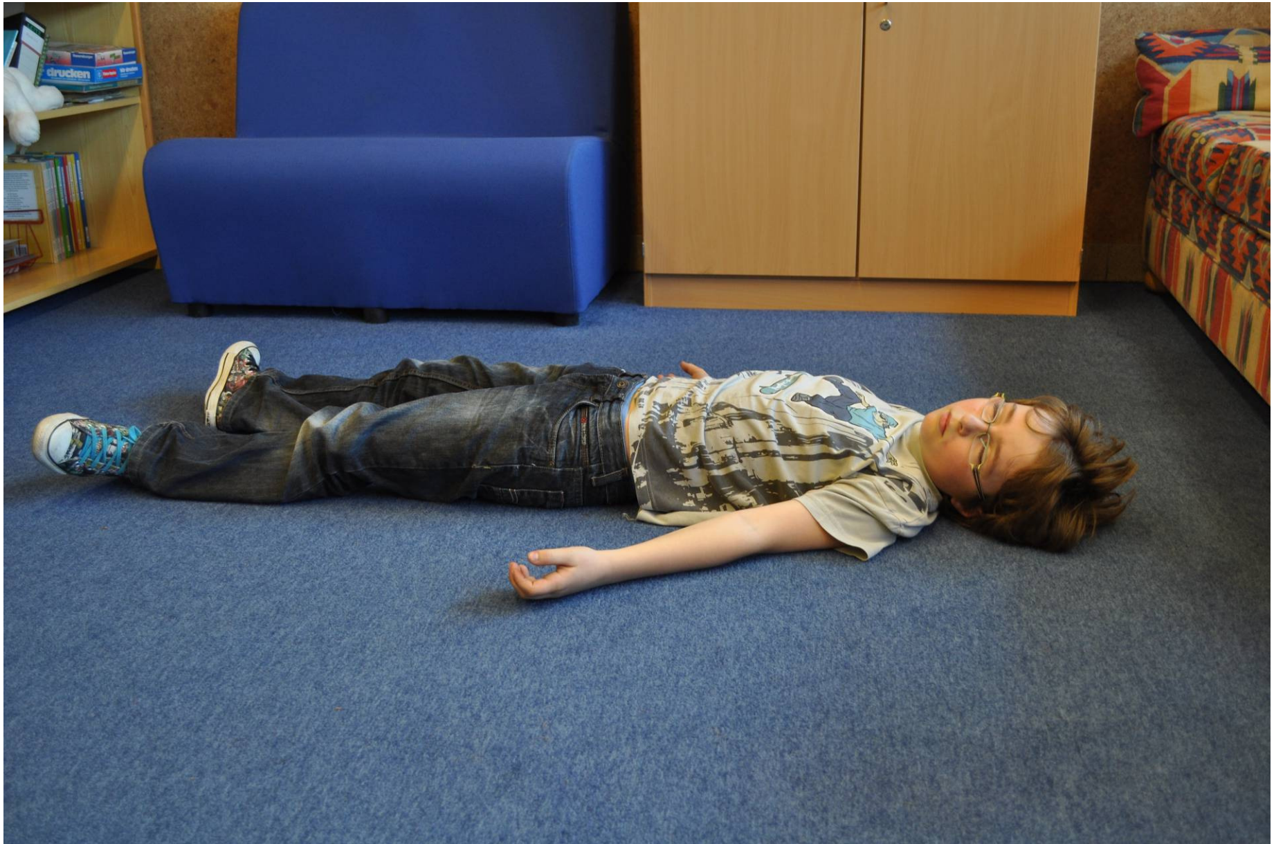
Ein Junge liegt bewusstlos auf dem Boden.